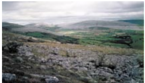
Bíonn deiseanna ag áitritheoirí agus ag turasóirí araon tírdhreacha iontacha na hÉireann a thaiscealadh agus taitneamh a bhaint astu. Táirgeann an GSI raon táirgí a mhéadaíonn an sásamh a bhaineann leo sin.