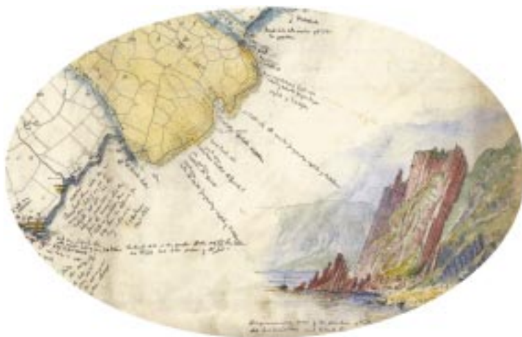
Chaith an GSI an chéad 50 bliain, go dtí na 1890daí, ag ullmhú léarscáileanna buncharraige mar iad seo agus tá éileamh mór i gcónaí orthu le taca a thabhairt d'obair ar thionscadail bonneagair, ar chosaint comhshaoil ar fhorbairt acmhainní mianraí.